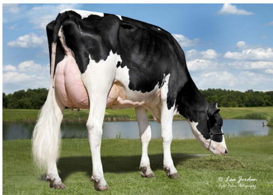
VANDOSKES SIGNATURE 3678