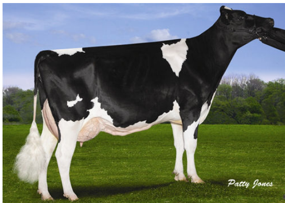
VISION-GEN SH FRD A12304